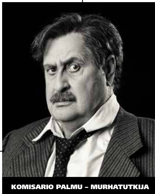
KOMISARIO PALMU - MURHATUTKIJA