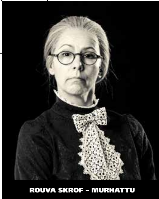
ROUVA SKROF - MURHATTU